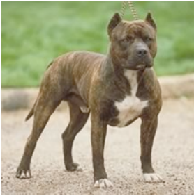
American Pit Bull Terrier

4. Identificar por medio de la observación personal o en una figura 25 clases diferentes de razas de perros.