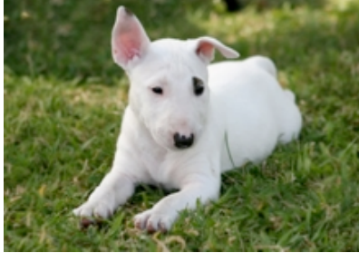
Bull terrier miniatura