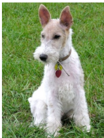
Fox Terrier Pelo Duro