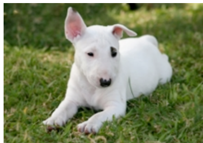
Bull terrier miniatura